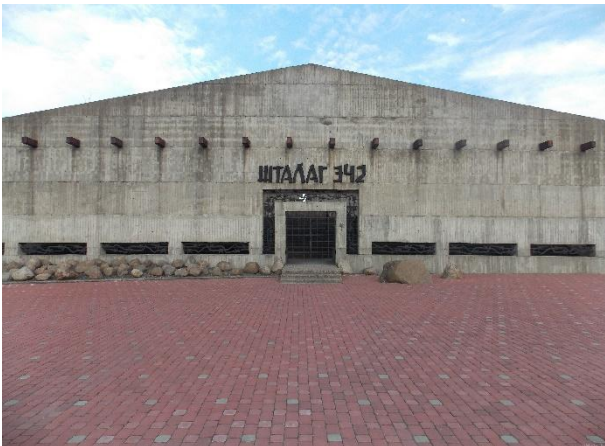
Мемориальный комплекс «Шталаг-342» расположен на ул. Замковая.